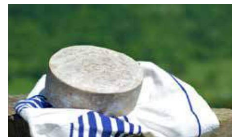
Fromage d'Ossau-Iraty