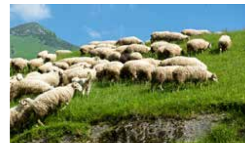
Troupeau de brebis