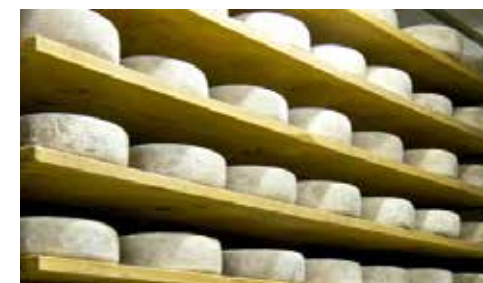
Fromages d'Ossau-Iraty

Xabat Baita 64122 URRUGNE 05 59 54 33 64 Horaires d'ouverture au public : tous les jours 15h-18h sauf dim. et jours fériés