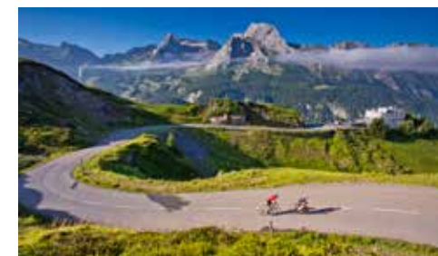
Cols Pyrénéens