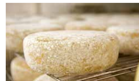
Fromage d'Ossau-Iraty