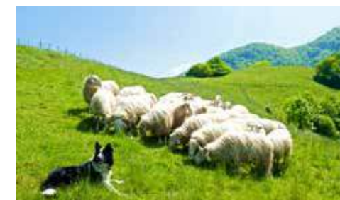
Route d'Ossau-Iraty