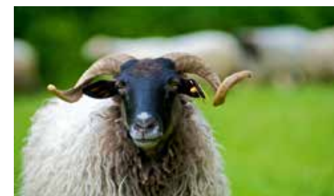
Brebis d'Ossau- Iraty ©AOP Ossau-Iraty