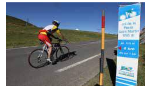
Col de la Pierre Saint-Martin