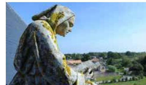
Collégiale de Saint-Marc-la-Lande