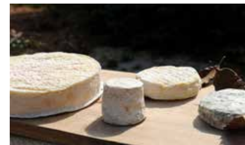
Fromage de Chèvre du Poitou

28, chemin du Puits Breilbon 79220 GERMOND-ROUVRE 05 49 04 05 11