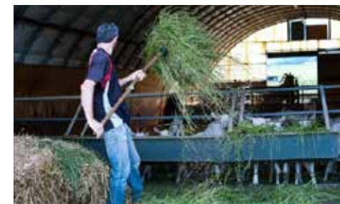
GAEC des Pampilles ©GAEC des Pampilles Les Haies