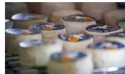
Fromages de chèvre