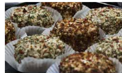
Fromages de chèvre