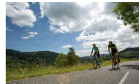
Cyclistes sur route