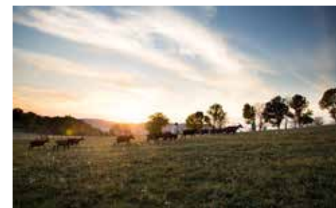
Ferme des Servanières à Ste-Catherine