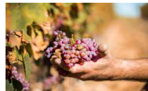
Vignoble Coteaux du Lyonnais