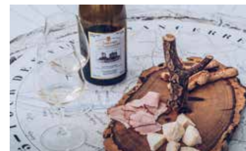
Assiette - Refuse To Hibernate