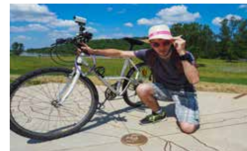
Kilomètre 0

29 rue du Commerce 18300 Saint-Satur Horaires d'ouverture au public : midi et soir du mardi au dimanche.