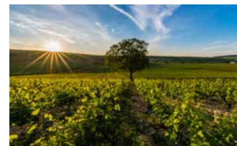
Vignoble - Lezbroz