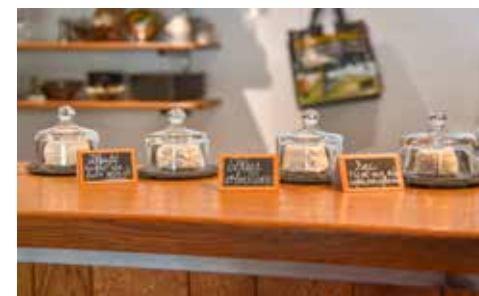
Bar à fromages - La Valise à Fleurs