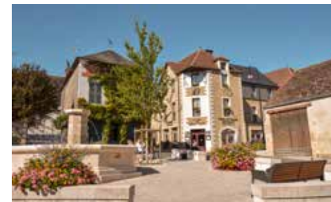
Chavignol - La Valise à Fleurs