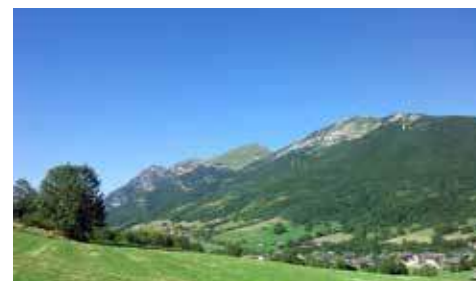
Tour du Colombier d'Aillon

177 avenue du Grand Verger 73000 Chambéry 04 79 62 30 11 Fromages : Tomme de Savoie IGP et Beaufort AOP Horaires d'ouverture au public : du lun. au sam. 9h-12h30 et 14h-19h, les jours fériés 9h-12h30, fermé le 01/05 Distance : 3,2 km