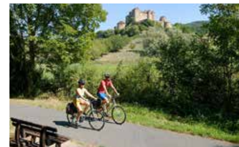
La Voie Verte