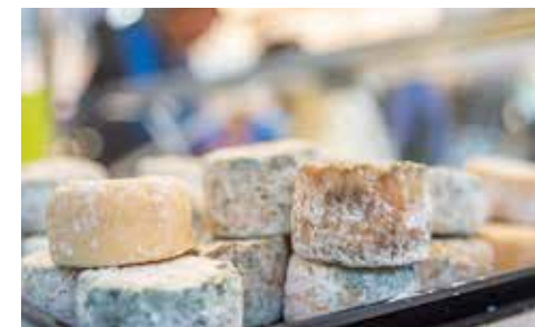
Marché de Cluny