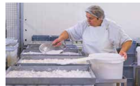
Fabrication de fromages de chèvre