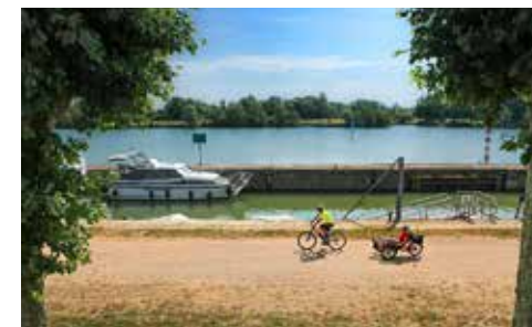
La Voie Bleue

Rue Rabelais 71260 FLEURVILLE 03 85 37 58 11 Horaires d'ouverture au public : lundi de 15h-19 h. Mardi au vendredi de 8h30-12h30 et 15h-19h. Samedi de 8h30-9h & dimanche de 9h-12h30. Distance : 6,6 km