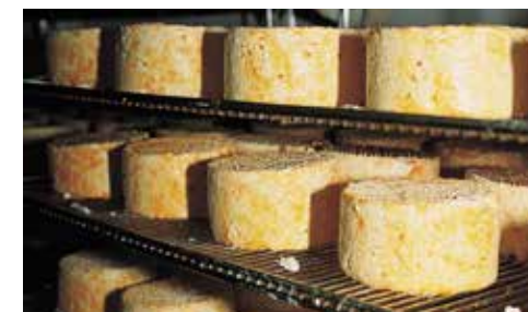
Fromagerie Delin à Cilly- les-Cîteaux