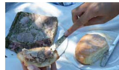
Pique-nique à Vougeot