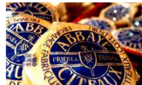
Fromage de cîteaux - Abbaye de Cîteaux