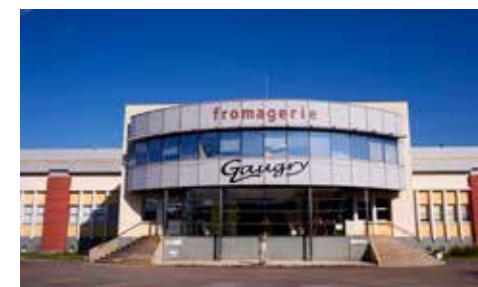
Fromagerie Gaugry à Brochon