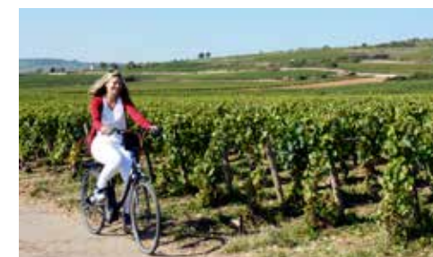
Balade à vélo dans les vignes