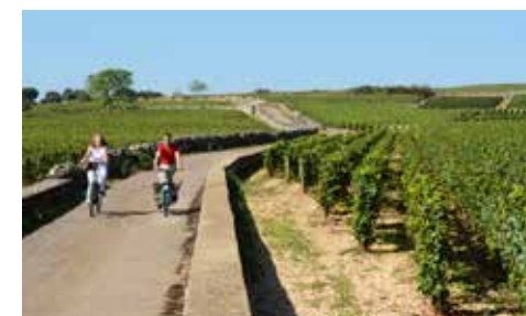
Balade à vélo dans les vignes