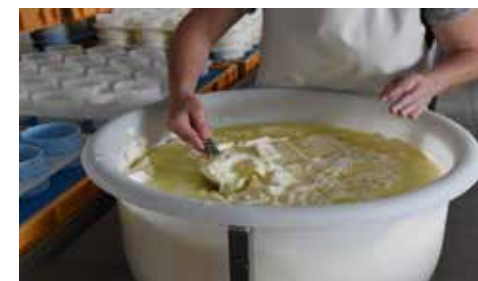
CAEC Leclère à Soumaintrain