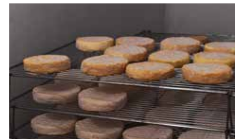
Ferme Lorne à Soumaintrain